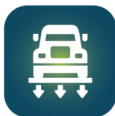
Postos de pesagem