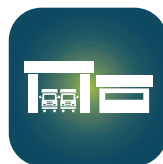
Base dos Serviços de Atendimento aos Usuários (SAU)