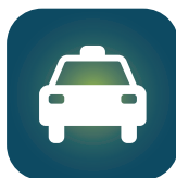
Veículo para inspeção de tráfego